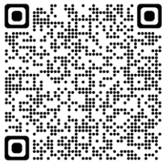
SCHU:COM Rubrik Angebote für Eltern